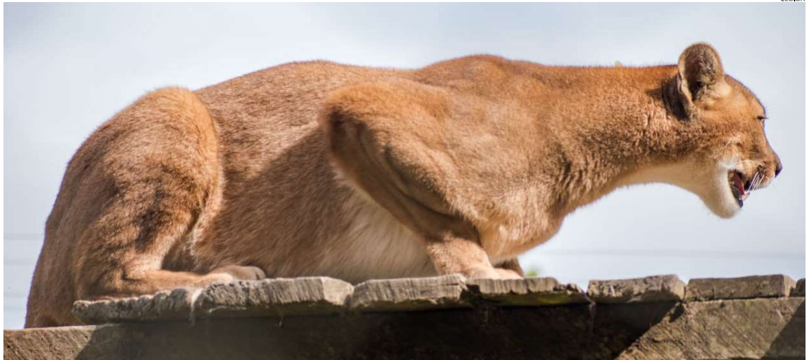
LA INTERVENCIÓN DEL HÁBITAT NATURAL DE LOS ANIMALES SILVESTRES ES UN ENEMIGO CONSTANTE PARA SU CONVERSACIÓN.

“Esto origina una problemática en la conversación y de cómo este país se hace cargo del respeto al ecosistema y todo lo que deriva de esta ausencia de acción. En el ámbito de la fauna silvestre, según lo declarado por los diferentes directores regionales del SAG que han pasado por ese cargo durante los últimos gobiernos; ellos tiene una función netamente fiscalizadora. Por esta razón están limitados logística y económicamente para hacerse cargo de la conservación de la fauna silvestre, diciendo hacer lo que está ‘dentro de lo posible’”, señaló,