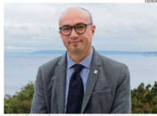
MANIFESTÓ SU PROPOSITO DE TRABAJAR EN CONJUNTO, CON TODOS.

En cuanto a la relación de vinculación con el medio regional y el aporte de la UACH en la región, anticipó que "debemos llevar adelante el plan de desarrollo de la Sede para el periodo 2020-2023. Debemos integrar aún más la Universidad con la sociedad por medio de